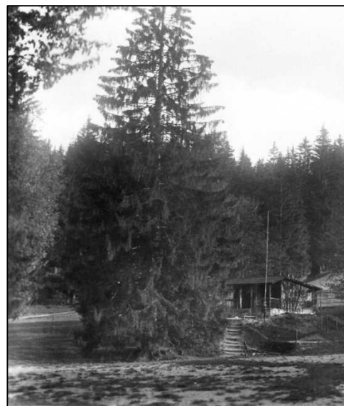
Před chatou mohutný smrk a pod ním studánka

Ať tak či tak, nejdříve v Mandli byla, třeba skládací, chatka Sokolů.